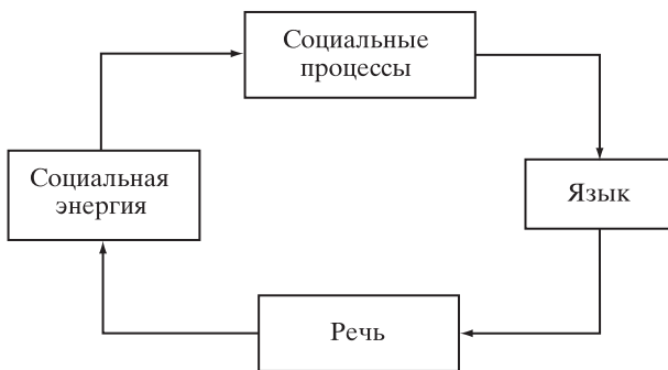
Рис. 2. Круговорот речи и социальной энергии.

личных форм публичного возмущения 9 . Тем самым, сама опция “голоса” оказывается как бы остаточной функцией “выхода”: если “выход” затруднен или невозможен, то активизируется “голос” 10 [Хиршман, 2009, с. 39]. Традиционная экономическая теория, описывающая капиталистическую систему с присущим ей избыточным предложением товаров, всегда делала акцент на опции “выход”, выводя тем самым на первый план феномен конкуренции. Между тем в социалистической экономике, например в СССР с присущим ему избыточным товарным спросом, гораздо большее значение имела опция “голос”. Так, во всех организациях страны присутствовала специальная книга жалоб и предложений, которая аккумулировала мнение экономических агентов; этой же цели служили многочисленные профессиональные и общественные собрания. Иными словами, рыночная экономика основана на голосовании ногами, а социалистическая экономика – на дискурсивных механизмах.