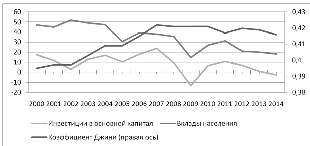
Рис. 2. Динамика инвестиций, сбережений и неравенства

Если рассматривать взаимосвязь экономического неравенства, инвестиций и сбережений, то, следуя логике либерального подхода, в России должен бы наблюдаться тренд их роста. Однако, как видно на рис. 2, устойчивая тенденция роста характерна только для коэффициента Джини. Рост концентрации доходов населения сопровождается снижением темпов роста вкладов населения и инвестиций. Особенно настораживает тенденция сокращения темпов роста инвестиций в машины и оборудование. Не случайно столь велика степень износа основных фондов (2005 г. – 45,3%, 2014 г. – 49,4%), которая неуклонно возрастает ( Федеральная служба... , 2015б. С. 68).