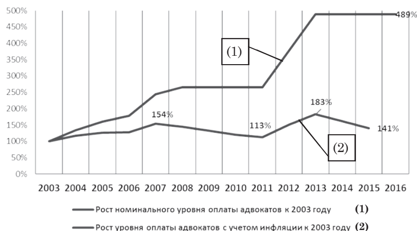
Рис. 2. Изменение номинального и реального уровня оплаты труда адвоката по назначению в сравнении с 2003 годом

В любом случае, по нашему мнению, руководство ФПА осознает, что ресурсы на работу по назначению являются очень важным фактором финансовой стабильности для массовой части адвокатского сообщества и могут использоваться как инструмент поддержания их лояльности по отношению к власти.