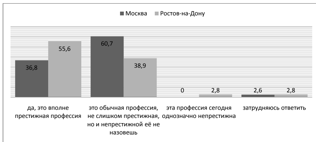
Рис. 1. Является ли профессия военного престижной в обществе? (в %)