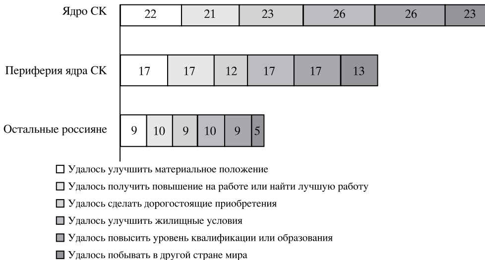
Рис. 2. Доля сумевших достичь в течение трех лет перед опросом тех или иных значимых улучшений своей жизни в различных группах населения, октябрь 2015 г. (в %)⁶.

нашей стране составляла 44% населения в целом. При этом, как и любая другая крупная социальная группа, средний класс не однороден. В нем можно выделить две его подгруппы. Это, во-первых, ядро среднего класса , относительное устойчивое со-