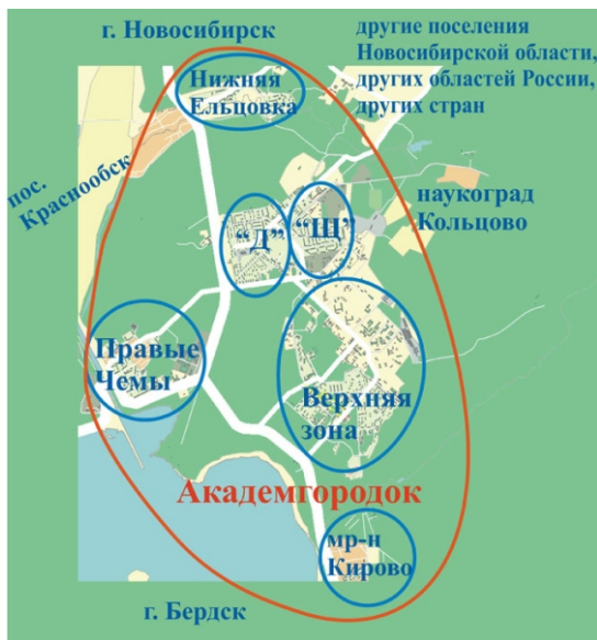
Рис. 2. Общий вид акторов (узлов) сети, предполагаемый в исследовании территориальной общности новосибирского Академгородка

В качестве примера локализации связей целесообразно привести общий вид акторов (узлов) сети, предполагаемый при исследовании территориальной общности новосибирского Академгородка (рис. 2). Акторы, расположенные внутри общности, представляют собой территориальные группы Академгородка, в качестве которых принято выделять следующие микрорайоны: Верхняя зона, «Щ», «Д», Нижняя Ельцовка, Правые Чемы, Кирово. В качестве внешних акторов выбраны территориальные группы, находящиеся в ключевых поселениях за пределами общности, – г. Новосибирск, г. Бердск, пос. Краснообск, наукоград Кольцово. Кроме них внешними акторами могут выступать совокупности жителей других поселений Новосибирской области, других областей России, других стран.