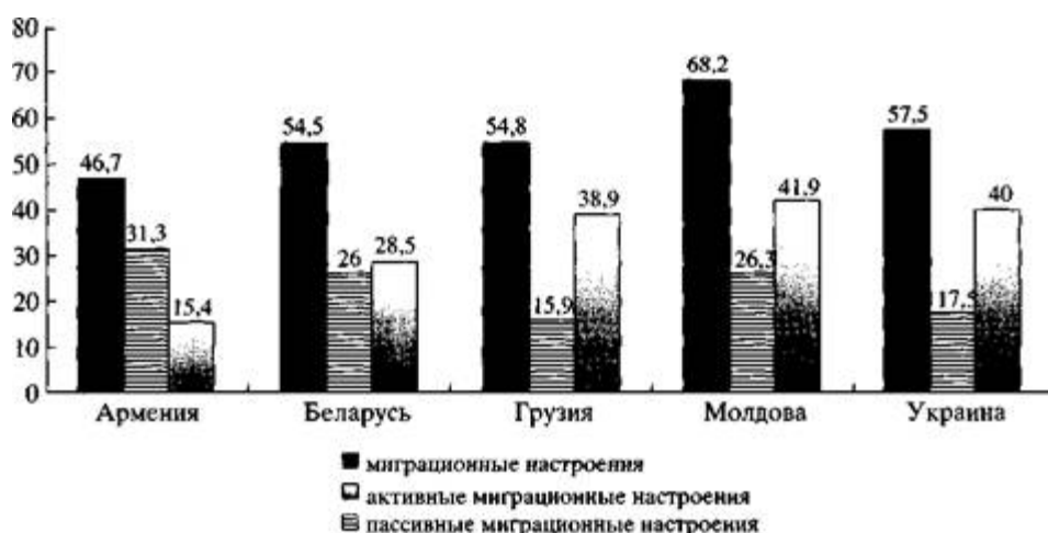
Рис. 2. Структура миграционных настроений населения (в %)

Несмотря на достаточно большое количество респондентов, отметивших появление в прошлом или наличие в настоящем миграционных настроений по поводу одной из вышеописанных моделей миграции, следует обратить внимание на то, что миграционные настроения делятся на активные и пассивные, которые существенно отличаются друг от друга. Пассивные настроения достаточно редко перерастают в активную форму, и их наличие у населения не является индикатором потенциального миграционного бума. Наличие же активных миграционных настроений предполагает определенные шаги или усилия со стороны их носителя, приближающие его к переезду в другую страну. Таким образом, из числа респондентов, отметивших наличие у них миграционных настроений, следует вычесть тех респондентов, кто ничего не предпринимал для их реализации.