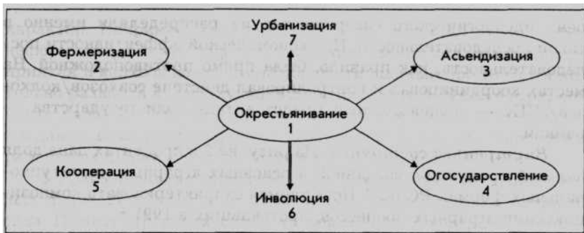
Рис. 1. Модель аграрной трансформации

совхозы" — точно передает суть подобной политики. На первоначальном этапе совхозы и колхозы как насосы выкачивали ресурсы из села, культивируя в нем индустриальную цивилизацию крупного производства. Предполагалось, что на последующих этапах уже развивавшаяся мощная индустрия социалистического государства обратным потоком сполна вольется в деревню и окончательно преобразит ее до такой степени, что исчезнут различия между городским и сельским существованием. Но даже формально советские сельские предприятия никогда не становились однородными, а делились на: 1) государственные — совхозы; 2) производственные кооперативы — колхозы; 3) личные семейные хозяйства — ЛПХ. По сте-