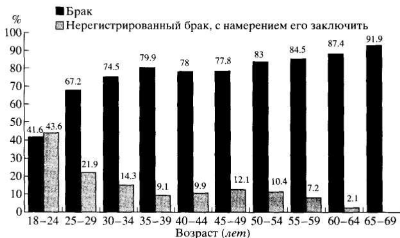
Рис. 3. Предпочтения в стратегиях создания семьи в Литве в зависимости от возраста (в

браков ("плохо" и "очень плохо"). Четвертая часть респондентов относится к этому нейтрально, и лишь единицы - положительно.