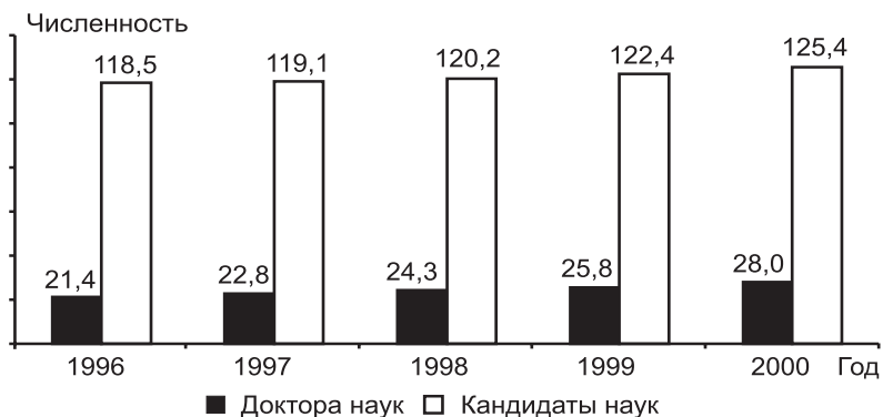
Рис. 1.2. Численность профессорско-преподавательского персонала государственных вузов, обладающего ученой степенью, тыс. человек