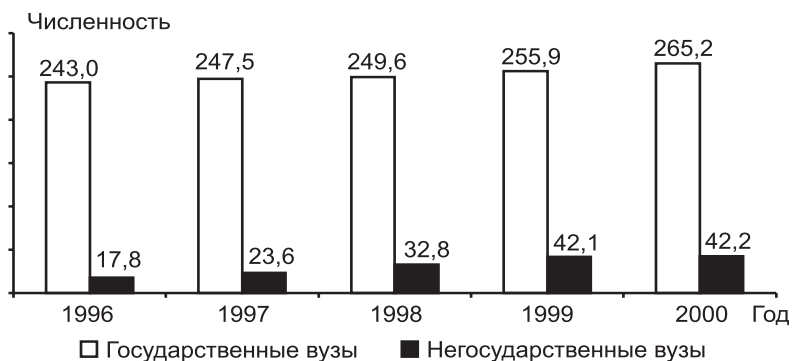
Рис. 1.1. Численность профессорско-преподавательского персонала в высших учебных заведениях, тыс. человек

Можно предположить, что квалификационный потенциал высшей школы устойчиво нарастает (что, очевидно, требует соответствующего увеличения расходов на его содержание).