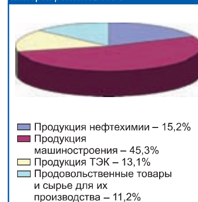
Диаграмма 5 Доля продукции в товарной структуре импорта регионов ПФО

Обзор подготовлен по данным пресс-служб администраций областей и республик, а также официальных интернет-сайтов федеральных, областных, республиканских министерств и ведомств.