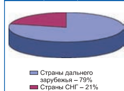
Диаграмма 1 Доля стран СНГ и дальнего зарубежья во внешнеторговом обороте ПФО

Химическая и нефтехимическая промышленность ПФО занимает ведущее ме-