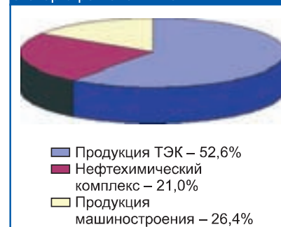
Диаграмма 4 Доля продукции в товарной структуре экспорта регионов ПФО

Внешнеторговый оборот Республики Татарстан в 2003–2004 годах вырос по