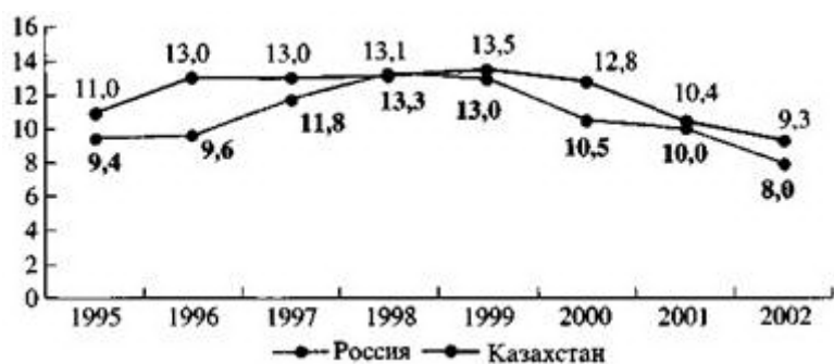
Рис. 2. Динамика безработицы в Казахстане и России в 1995 - 2002 гг. (% к экономически активному населению)

ческой" или рыночной бедности, связанной с местом определенных категорий экономически активного населения на рынке труда.