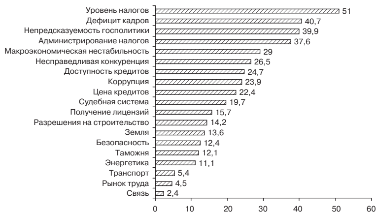
Рис. 4.2. Оценка предприятиями уровня серьезности проблем, возникающих по отдельным компонентам обобщенного делового климата (доля тех, кто считает проблему серьезной и очень серьезной), % от числа ответивших

ми обрабатывающей промышленности. На рис. 4.2 показано, что уровень и администрирование налогов беспокоит соответственно 51 и 38% предприятий. Как правило, во всех странах предприниматели в первую очередь жалуются на налоги, независимо от их абсолютного уровня. Однако наше исследование продемонстрировало, что аномально высокое место заняли проблемы качества рабочей силы и неопределенность государственной политики . Связь, транспорт и регулирование трудовых отношений, с другой стороны, не представляют серьезных проблем как барьеры ведению бизнеса.