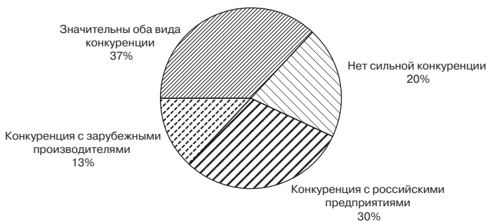
Рис. 4.3. Распределение предприятий по уровню и типу конкуренции

туризации. Экспортная ориентация, напротив, положительно связана с рентабельностью и инновационной активностью, хотя и не оказывает существенного влияния на темпы роста.