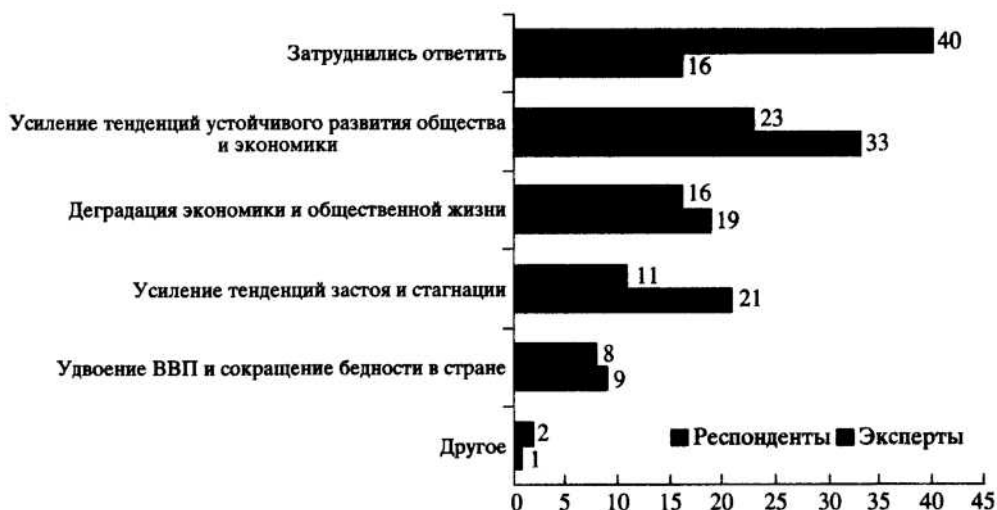
Диаграмма 3. Мнение респондентов о том, какой сценарий будущего наиболее вероятен для России 2008 года (% от числа опрошенных)

В будущем, по мнению респондентов и экспертов, в первую очередь актуализируются такие стороны процессов глобализации, как охрана окружающей среды, борьба с бедностью, нищетой, терроризмом. Интегрально мнение респондентов по проблемам развития в будущем можно было бы интерпретировать следующим образом. Возникновение глобальных проблем человечества требует проведения скоординированной в границах мирового сообщества политики государств. Стратегической целью этой политики на всей планете становится устойчивая коэволюция человека, общества и природы. Направлении политики концентрируются и гармонизируются в единстве антропо-, социо- и экосферной составляющих.