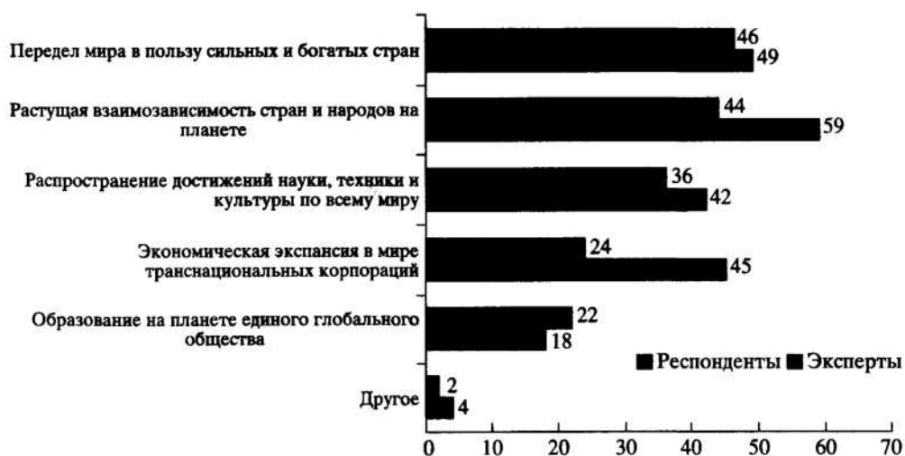
Диаграмма I. Распределение мнений респондентов по вопросу о том, какие процессы в жизни в большей степени отражает понятие "глобализация" (% от числа опрошенных)

казало примечательное отличие во мнениях респондентов и экспертов. Экспертное, научное сознание по своей природе привыкло оперировать по возможности рационально точными, определенными по сущности и форме категориями и понятиями. Поэтому на первое место оно поставило альтернативу, в соответствии с которой глобализация представляет собой "растущую взаимозависимость стран и народов на планете" (59%). Такой ответ соответствует доминирующей точке зрения в научных источниках и учебниках. Массовое сознание по своему происхождению и формам проявления не столь рационалистично. В своей большей части оно формируется СМИ и каналами межличностного общения, которые привыкли и широко оперируют в целях убедительности и манипуляций эмоциональными оценками и образами. Поэтому выбор альтернативы "передел мира в пользу сильных и богатых стран" (46%) вполне соответствует в конкретном случае как логике и характеру формируемой СМИ информационной картины процессов глобализации, так и законам функционирования массового сознания. И все другие различия ответов у экспертов и респондентов отражают указанное отличие эмоционально-образного и рационального восприятия феномена глобализации.