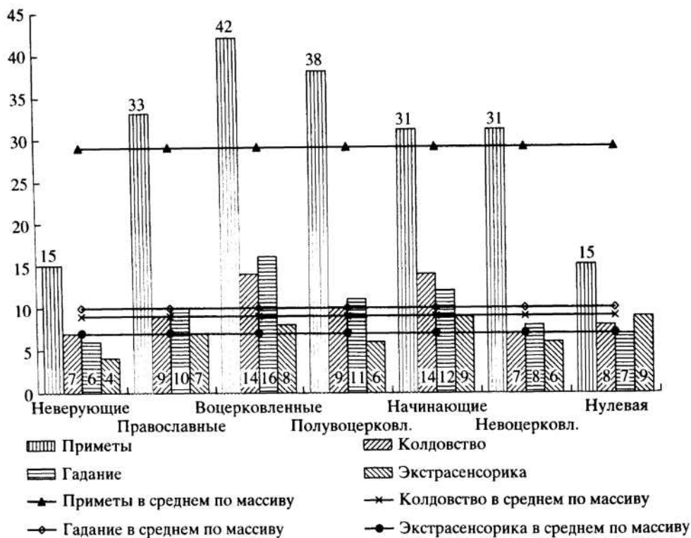
Рис. 1. Доля активных суеверных по приметам, колдовству, гаданиям, экстрасенсорике.

сенсам, верят в «переселение душ». «Начинающих» привлекает все сверхъестественное, мистическое, и они пока плохо дифференцируют источники этих явлений, недопонимают церковную христианскую догматику и пока не очень стремятся с ней познакомиться. В такого рода двойственности и заключается специфика этой группы. Возможно, специфика этой группы обусловлена тем, что 37% ее составляет сельское население.