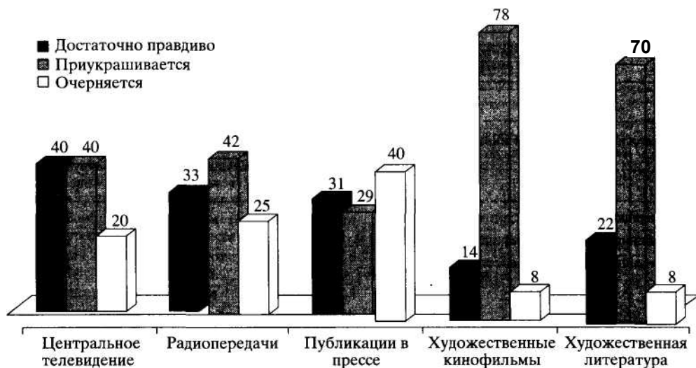
Рис. 2. Мнения граждан об освещении работы милиции разными источниками информации (в % от числа ответивших)

лениях о милиции основная часть населения в значительной степени опирается на художественные образы. Наибольший интерес к художественной информации о милиции проявляют пенсионеры, безработные, учащиеся.