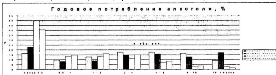
Рис. 2. Ежегодное потребление алкоголя по результатам исследований (%)

В первую модель логистической множественной регрессии в качестве детерминант вошли две переменные, характеризующие потребление (объем и частота), а также пол и возраст. Во вторую модель логистической множественной регрессии после исключения вклада объема потребления и частоты алкоголизации были введены ситуационные характеристики потребления (компания, место, время и повод выпивки).