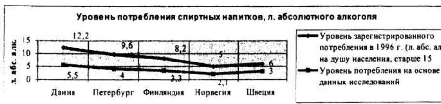
Рис 1. Уровень потребления спиртных напитков в странах Скандинавии и Петербурге (л. абс. алк.)

Финляндия представляет интерес для сравнительного анализа и как страна, близкая к России по географическими и историческим характеристикам, и как типичное западноевропейское государство, традиции, культура и политические институты которого были во многом заимствованы из Германии, Швеции и англосаксонского мира.