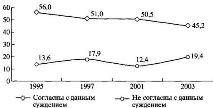
Рис. 1. Динамика отношения к суждению "Демократические процедуры очень важны для организации в обществе нормальной жизни. Без них не обойтись", в %

институтам, отмечают их значимость для жизни страны и для собственной жизни. В частности, большинство респондентов - 45% в 2003 г. продолжает считать, что "демократические процедуры очень важны для организации жизни общества", тогда как не согласных с этим существенно меньше (19%). Одновременно за последние 8 лет доля тех, кто считает эти процедуры необходимыми, снизилась более чем на 10% и составляет сегодня менее половины населения (рис. 1).