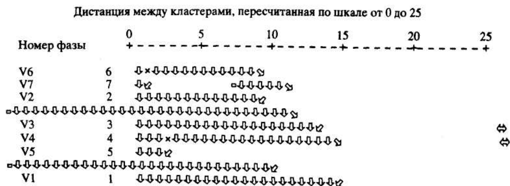
Рис. 4. Дендрограмма иерархического кластерного анализа коэффициентов детерминации для семи фаз проведения рыночных реформ в России за последние 10 лет

Дендрограмма на рис. 4 показывает, что заметно выделяются две группы фаз по предсказуемости отношения респондентов к социальному времени, разделяемых на два кластера: в первый кластер входят фазы 1, 5 и 4 - с высокой предсказуемостью (отметим, что фаза 4 спада, доведенного до дефолта августа 1998 года, характеризуется также высокой предсказуемостью); во второй кластер входят фазы 3, 2, 6 и 7, имеющие низкую предсказуемость, в этом кластере можно выявить подкластер еще менее предсказуемых фаз 6 и 7.