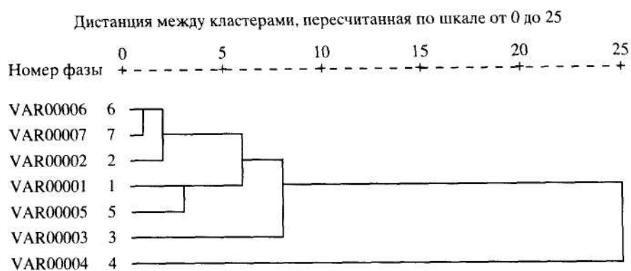
Рис 3. Дендрограмма кластеров (групп) из семи фаз проведения рыночных реформ в России за 10 лет по близости качества социального времени на них

2. Отрицательный коэффициент регрессии для позитивно относящихся к социальному времени обозначаем как коэффициент регресса социального времени (КРСВ). Он означает увеличение количества респондентов с отрицательным отношением к социальному времени в общественном сознании этого слоя в течение определенной фазы.