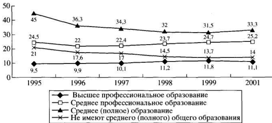
Рис. 1. Состав безработных, зарегистрированных в органах Службы занятости, в зависимости от образования (данные на конец года)

и 54,6% от заработной платы в промышленности, к 1993 году значения этих величин составили 67,6% и 63,2% соответственно.