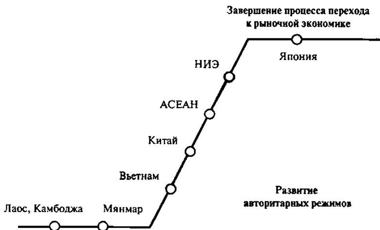
Рис. 1. Модель догоняющего развития в Восточной Азии

зываемой США 4 ) и внутренних (национализм) условий стал краеугольным камнем экономической политики в Азии. Неодевелопментализм 1980-х гг. сделал ставку не только на приоритет развития экспортоориентированной промышленности в рамках мобилизационной политики, но и на гармоничное сочетание идеологии роста и идеологии либерализма [Suehiro 2000]. В Азии девелопментализм сумел доказать свою жизнеспособность.