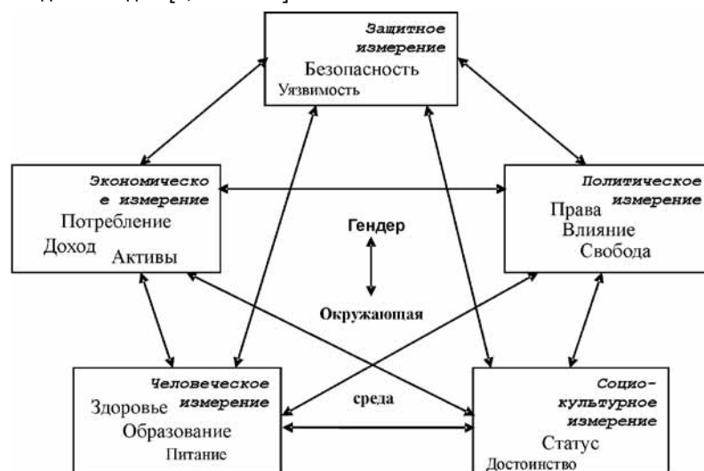
Рис. 2. Взаимосвязанность измерений бедности [11, р. 39].

Домохозяйства или индивиды могут потреблять мало и быть уязвимыми из-за отсутствия активов, неадекватного дохода, плохого здоровья, образования или потери производственных активов в результате неблагоприятных обстоятельств. Отсутствие прав человека или политических свобод, уязвимость и социальная эксклюзия ограничивают человеческие и политические возможности, сокращая доход, активы и так далее. Гендерное неравенство затрагивает все измерения бедности, потому что бедность не является гендерно нейтральной. Процессы, порождающие бедность, влияют на мужчин и женщин различным образом и в различной степени. Женская бедность является более распространенной и более жестокой, чем мужская. Деградация окружающей среды, природные катаклизмы, являясь, до определенной степени, результатом бедности, в большей степени влияют на бедных людей [8, с. 38–40].