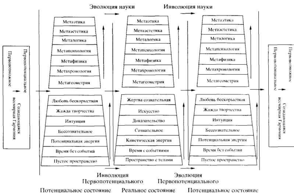
Рис. 1. Возникновение и развитие мира по К.Ф. Жакову

познание и постижение" [14, с. 38]. Потенциальные состояния этих категорий определяются Жаковым как "потенциальные, скрытые свойства общества", а реальные - как "явные свойства общества" [18, с. 82].