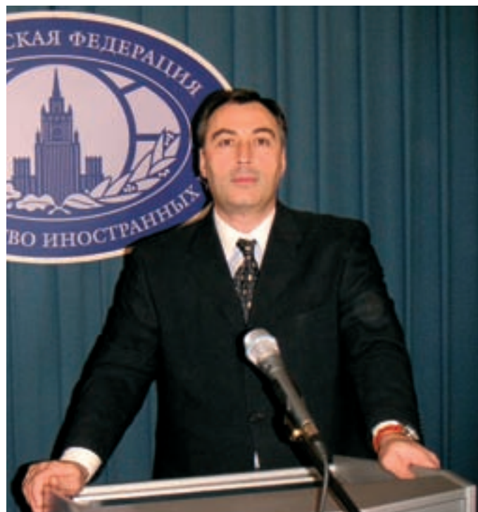
А.Л. Кондаков, директор департамента экономического сотрудничества МИД РФ