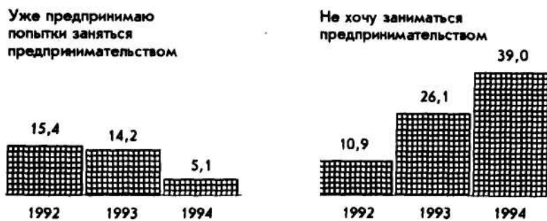
Рис. 3. Готовность россиян к занятиям предпринимательской деятельностью

Таким образом, россияне прошли, а частично еще и проходят, этап повального соблазна предпринимательской деятельности, связанного с ее престижностью и доходностью, и начинают постепенно делать выбор в пользу других типов занятий.