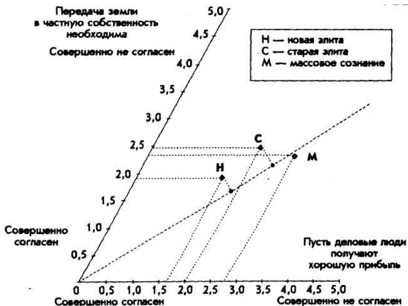
Рис. 3. Позиции старой элиты, новой элиты и населения в целом по отношению к конкретным аспектам рыночной экономики

ния элитных групп и массового сознания по рассматриваемому кругу вопросов разнонаправленна. В этом смысле ruling class постсоветской России — маргинален.