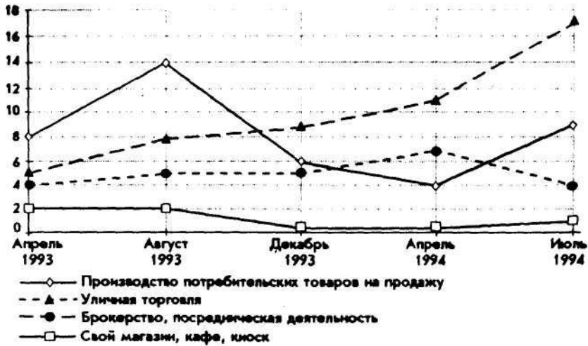
Рис. 2. Распространенность различных видов дополнительной занятости, апрель 1993 — июль 1994 гг. (в % к числу работников, имеющих дополнительную работу)

профессиональную деятельность по контракту, заказу (6%), а также частные уроки, репетиторство (3%).