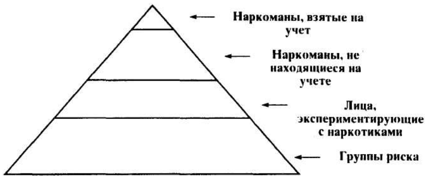
Рис. 1. Информационная модель "наркополя"

На ступеньках условной лестницы размещаются агенты поля, причем на каждом последующем уровне их общее количество меньше, чем на предыдущем. Так, пробуют марихуану миллионы школьников, студентов, молодых людей, но заболевают наркоманией - на порядок меньше, а попадает на учет милиции или наркологов совсем незначительная доля агентов поля. Эта лестница характерна еще одним - последовательностью ступеней. "Закон лестницы" заключается в том, что предыдущая ступенька является непосредственной причиной для перехода в следующую, более "высокую" группу. Специалисты Колумбийского университета определили, что для тех индивидов, которые в возрасте от 12 до 17 лет употребляли марихуану, вероятность употребления кокаина в 85 раз больше, чем для части молодежи, которая не курила марихуану [4, с. 5].