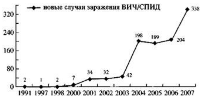
Рис. 2. Сравнительные данные по годам количества официально зарегистрированных пациентов в центрах борьбы с ВИЧ/СПИД