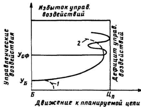
Рис. 3. Движение объекта управления к планируемой цели

практическую значимость. В этих условиях преобразования смогут набирать высокие темпы. Преобладание потенциала нового - важнейшая предпосылка для выявления и наиболее полного использования созидательных резервов человеческого фактора.