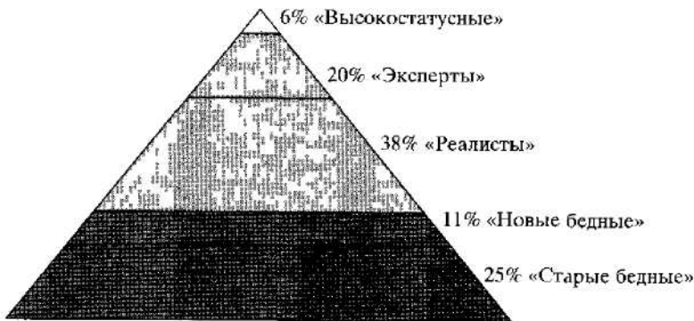
Рис. 1 Социальная стратификация российского общества

Иерархическое строение общества позволяет говорить о существовании социальной дистанции между социальными слоями, что определяет различия в их восприятии тех или иных социальных явлений, самоидентификацию относительно среднего слоя, социокультурные характеристики и ценностные ориентации Так, отмечается прямая зависимость положительных оценок реформ, рыночной экономики и влияния реформ на жизнь самого респондента от его места в социальной иерархии (рис 2)