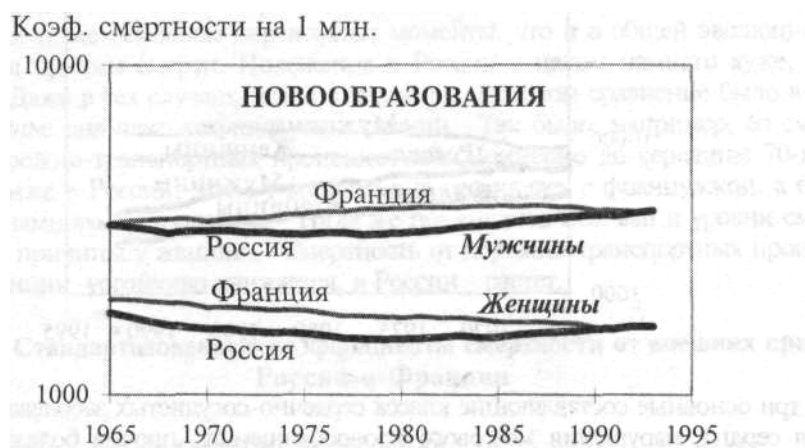
Рис. 3. Стандартизованные коэффициенты смертности от новообразований в России и во Франции в 1965-1993 г.

Хотя смертность от новообразований в целом в России ниже, чем во Франции, по отдельным опухолевым заболеваниям это не всегда так. В частности, в России хуже положение с раком органов дыхания - ведущей причиной смерти в классе новообразований у мужчин в обеих странах, тесно связанной с распространением курения.