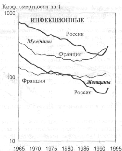
Рис. 2. Стандартизованные коэффициенты смертности от инфекционных болезней в России и во Франции в 1965-1993 гг.

В России эволюция смертности от инфекционных болезней определяется, в основном, смертностью от туберкулеза. Эта болезнь преобладает в классе инфекционных болезней: в разные годы на ее долю приходилось от 70 до 90% всех смертей от инфекционных заболеваний у мужчин и от 40 до 70%, соответственно, у женщин. Существенный рост смертности обоих полов от этой болезни с 1992 г. - тревожный показатель, он свидетельствует о значительном расширении соответствующей группы риска.