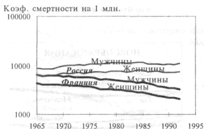
Рисунок 4. Стандартизованные коэффициенты смертности от сердечно-сосудистых заболеваний в России и во Франции в 1965-1993 гг.

Все три основные составляющие класса сердечно-сосудистых заболеваний - заболевания сердца, нарушения мозгового кровообращения прочие болезни системы кровообращения - участвуют в ухудшении ситуации, подчинены одной и той же тенденции: смертность от них мужчин и женщин растет в России и снижается во Франции, разрыв между двумя странами увеличивается.