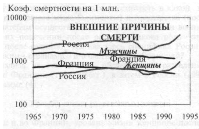
Рис. 5. Стандартизованные коэффициенты смертности от внешних причин в России и Франции

В России, особенно у мужчин очень высока насильственная смертность, не связанная с несчастными случаями. С 1965 г. мужская смертность от самоубийств превышала на 50 % смертность от самоубийств во Франции, а смертность от убийств в России была выше