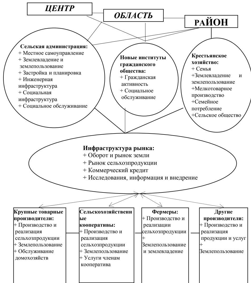
Рис. 6.3. Институциональная структура в сельской местности пореформенной России

Отмеченная ранее в качестве первой составляющей проблема сбалансированности питания может рассматриваться именно как семейная . Естественно, что она характерна для семей с низким человеческим капиталом, обеспечивающих себя в лучшем случае огородной продукцией, т.е. углеводами. Низкий уровень пенсионного обеспечения, особенно после 17 августа 1998 г., сделал для таких семей практически недоступными не только продукты, содержащие белок и животный жир, но и растительные жиры и сахар. Поэтому целевой ряд продовольственных продуктов по линии гуманитарной помощи для таких семей может иметь следующий вид: мясо (рыба), животное, растительное масло, маргарин, сахар, крупы и макаронные изделия. Характерные высказывания в семьях, действительно нуждаю-