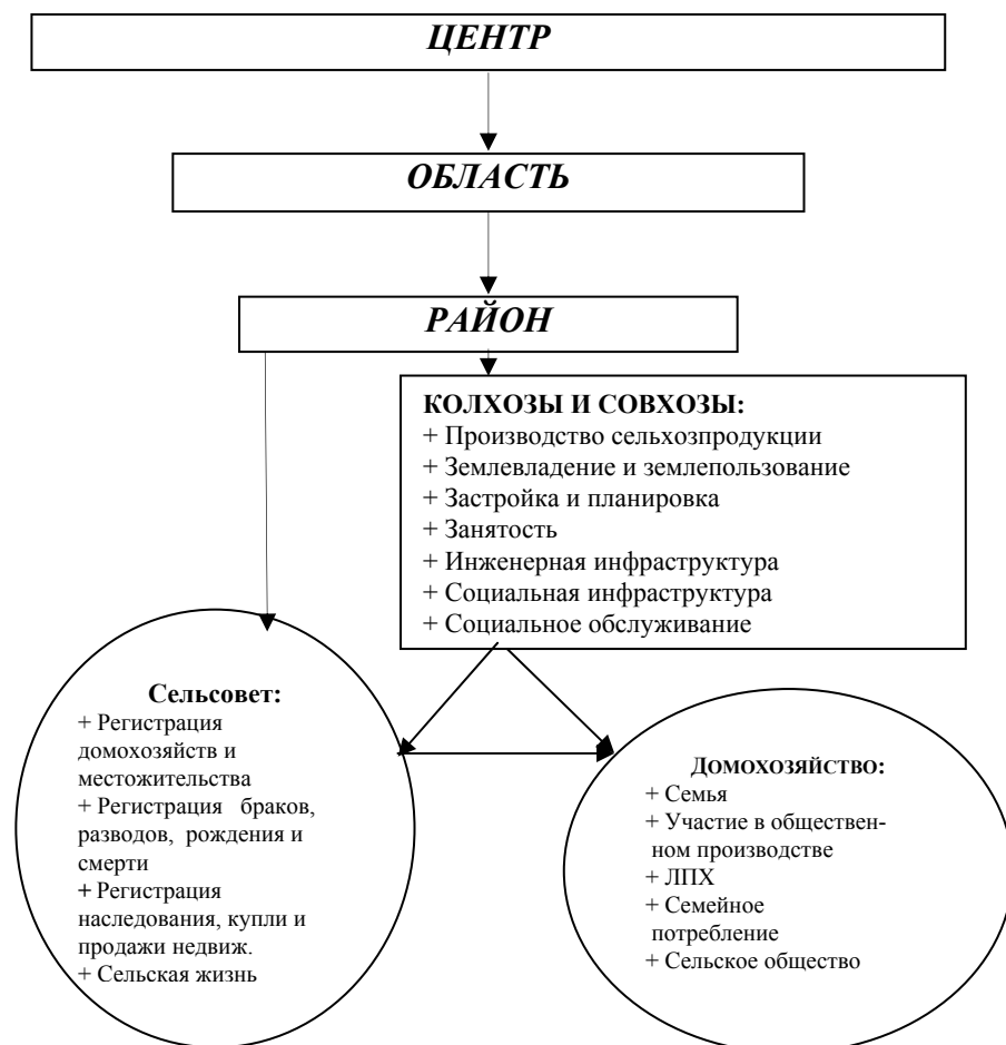
Рис 6.1. Институциональная структура в сельской местности в советской России

Третья. Домохозяйства и семьи в них рассматривались как агенты личного потребления. Поэтому землеотвод и жилищное строительство осуществлялись по нормативам, рассчитанным на основании достигнутого уровня общественных потребностей и потребления, и строго регламентировались. Различия допускались только с учетом национально-культурных особенностей союзных республик (грузинское село, литовское село и т.п.). При этом по умолчанию принималось допущение, что российское, украинское и белорусское село не имеют ярко выраженных особенностей, более склонны к восприятию всего "нового", а поэтому лучше других готовы к унификации и типовой застройке. Подобная практика вела к тому, что фактически весь новый жилой фонд вводился в строй морально устаревшим и слабо соответствующим современным потребностям и стандартам поведения сельского населения.