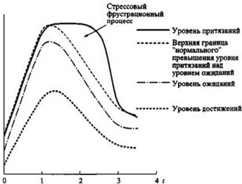
Рис. 1. Гипотетическая картина развития стрессового фрустрационного процесса. Примечание: Здесь и в рисунках 2 и 3 я никак не обозначаю размерность оси Y, потому что таких размерностей может быть много. В простейшем случае изображенные на графике показатели могут оцениваться в денежной форме. Тогда роль размерности оси Y будет играть та или иная денежная единица.

8 Некоторые политологи существование двух рассматриваемых процессов признают, хотя никаких специальных названий им не присваивают (см., например, [Хантингтон, 2004, с. 72 - 73]).