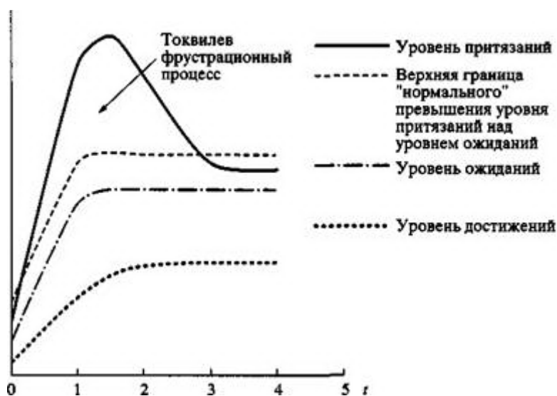
Рис. 3. Гипотетическая картина развития токвилева фрустрационного процесса ("спокойный" вариант).

притязаний, и затухания токвилева процесса - стабилизацию ситуации (прекращение роста уровня достижений).