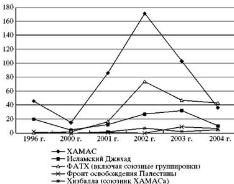
Рис. 1. Соревнование террористов: жертвы - граждане Израиля (только гражданские лица).

мально (при том, что так называемые "независимые" во многих случаях также были связаны с ФАТХом). Тогда же состоялись и "президентские выборы Арафата".