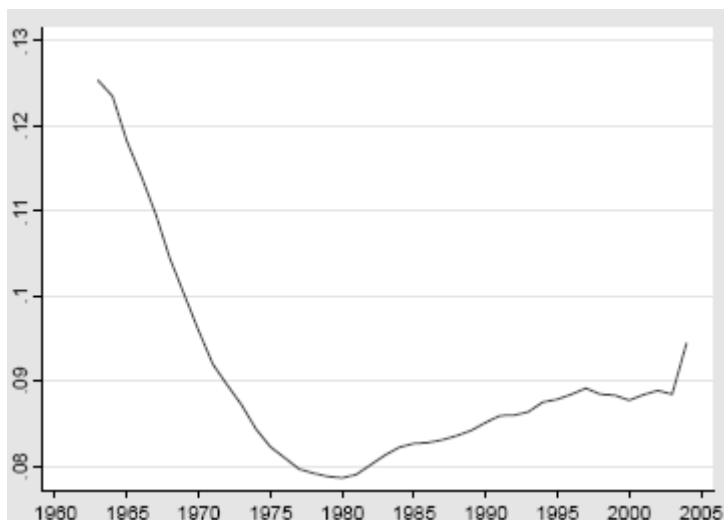
Рис. 3. Доля частных школ в общем количестве школ, Англия, 1963–2004 гг.