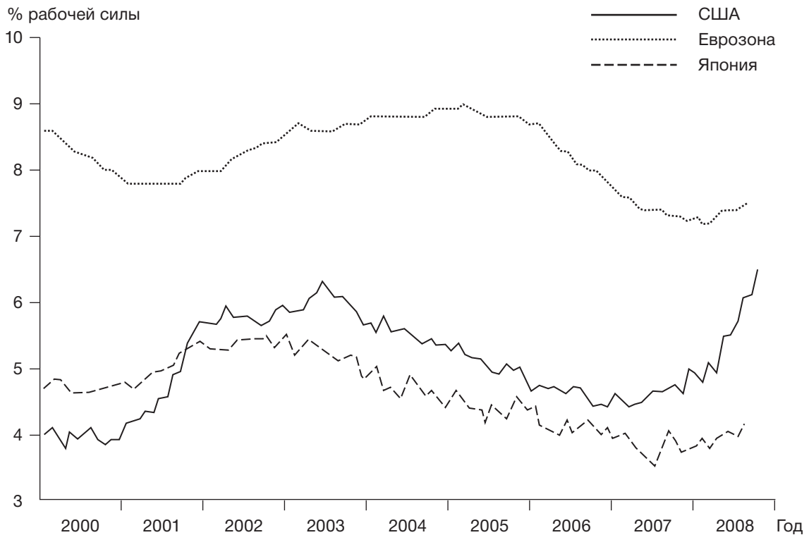
Рис. 1. Уровень безработицы в ряде стран ОЭСР