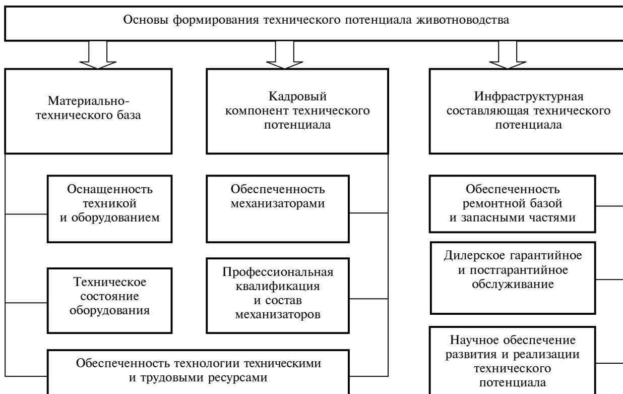
Рис. 1. Формирование технического потенциала животноводства

• большое значение при формировании технического потенциала животноводства имеет научное обеспечение его развития и реализации.