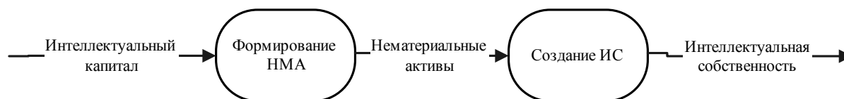
Рис. 1. Преобразование интеллектуального капитала

В рамках сформулированных положений автор статьи поднимает вопрос о необходимости эффективного управления собственностью Союзного государства на базе ранних индикаторов и прогноза рисков. Теоретические основы собственности определяют имущественные права на интеллектуальную собственность как результат наличия нематериальных активов. В свою очередь, нематериальные активы являются конечной формой функционирования интеллектуального капитала (ИК) организаций Союзного государства (рис. 1).