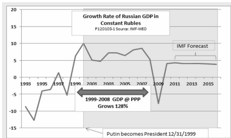
График 1. Динамика ВВП России в годы первого президентства В.В. Путина 1

реальный ВВП России увеличился на 82%, а паритет покупательной способности, вызванный устойчивым ростом курса рубля, — на 128% (см. график 1).