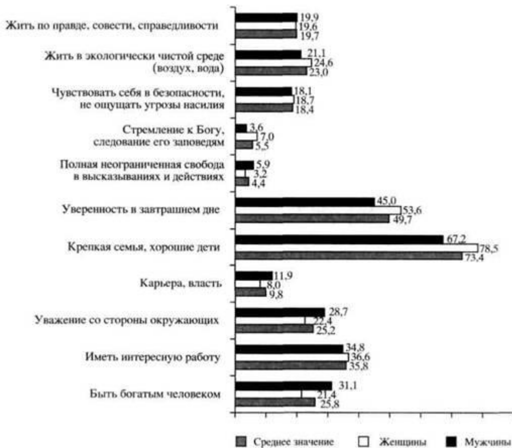
Рис. 3. Ценности россиян (в % от общего числа опрошенных россиян и численности в каждой тендерной группе)

Но, может быть, семья уже перестала быть главным смыслом и приоритетом женщины и мужчины, а ее место в системе жизненных ценностей заняла карьера и материальный успех? Нет, это не так. Как показывают результаты исследования образа жизни (2008), семья, а не свобода от семьи остается основной жизненной стратегией и жизненным смыслом российских женщин (рис. 3).