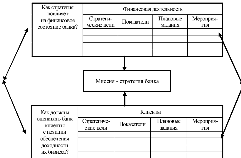
Рис. 2. Примерная схема стратегической карты во взаимосвязи с направлениями банка

3-й этап. Определение ключевых показателей эффективности (КПЭ), связанных со стратегическими целями, которые предусматривают такие атрибуты, как единица измерения, значе-