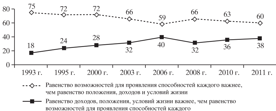
Рис. 1. Выбор россиян в дилемме “равенство возможностей – равенство условий жизни” (в %)*.

* На рисунке не представлены затруднившиеся с ответом.