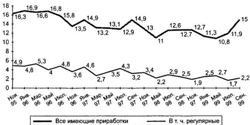
Рис. 8.2. Распространённость дополнительных приработков среди всего населения России (данные ВЦИОМ 1996–1999 гг., %)