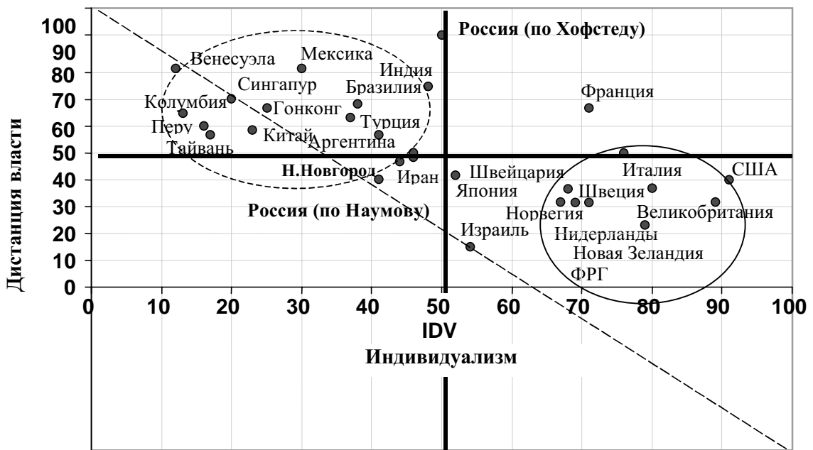
Рис. 1. Соотношение индикаторов индивидуализма и дистанции власти

Экономический вестник Ростовского государственного университета 2003 Том 1 № 3