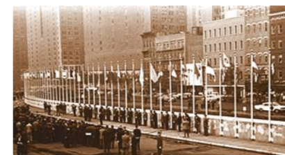
Flagraising of 16 new Member States at UN Headquarters, New York, 30 Sep 1960 Поднятие флагов 16 новых государств – членов ООН. Нью-Йорк, 30 сентября 1960 года