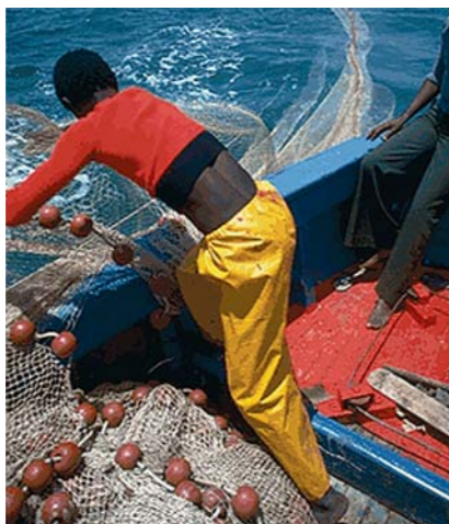
FAO and UNDP assist in exploiting fish resources. Joal, Senegal, 1976

Женская бригада на строительстве дороги в Лесото. Лесото, 1969 год