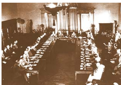
Conference on Security Organisation for Peace in Post-War World (Dumbarton Oaks). Washington, D.C. 21 Aug 1944 Конференция по вопросу о создании Организации по поддержанию безопасности во имя мира в послевоенном мире (Думбартон-Окс). Вашингтон, О.К., 2 августа 1944 года