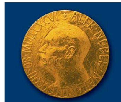
Nobel Peace Prize awarded to UN peacekeepers in 1988. New York, Oct 1988

Сотрудник Красного Креста Соединенного Королевства помогает жертвам засухи. Лагерь Бати, Эфиопия, 5 ноября 1984 года