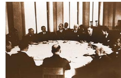
USSR Prem. Stalin, US Pres. Roosevelt and UK PM Churchill, Yalta, USSR, 12 Feb 1945. Председатель Совета министров СССР Сталин, президент США Рузвельт и премьер-министр Соединенного Королевства Черчилль. Ялта, СССР, 12 февраля 1945 года

UNICEF, the United Nations Children's Fund, is awarded the Nobel Peace Prize.