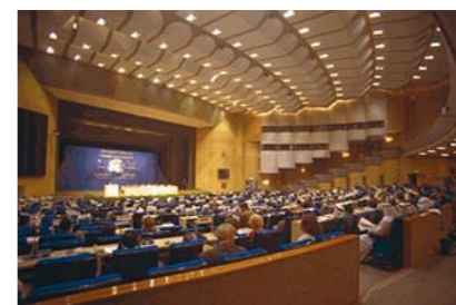
Intl. Conference on Population and Development, Cairo, Sep 1994

Нобелевская премия мира, присужденная миротворцам ООН в 1988 году. Нью-Йорк, октябрь 1988 года