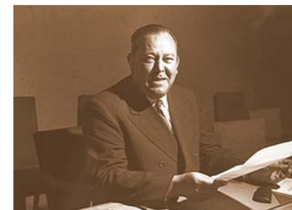
SG Trygve Lie, Norway, elected 1 Feb. 1946, Lake Success, New York, Aug 1949 Генеральный секретарь Трюгве Ли (Норвегия). Лейк-Сагсесс, Нью-Йорк, август 1949 года