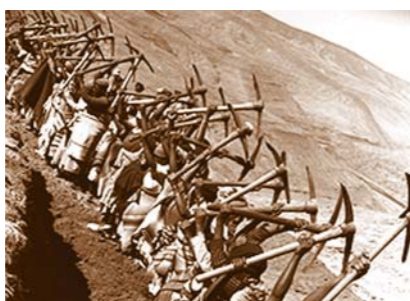
In Lesotho, a female work crew builds a road, Lesotho, 1969

Индийский юноша носит кирпичи, чтобы заработать на жизнь. Индия, 1979 год