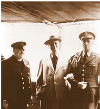
UK PM Churchill, US Pres. Roosevelt at Atlantic Charter. HMS Prince of Wales, 14 Aug 41 Премьер-министр Соединенного Королевства У. Черчилль, президент США Ф. Рузвельт при подписании Атлантической хартии. Корабль Его Величества «Принц Уэльский». 14 августа 1941 года

The first blueprint of the UN was prepared at a conference held at a mansion known as Dumbarton Oaks in Washington, D.C. During two phases of meetings which ran from 21 September through 7 October 1944, the United States, the United Kingdom, the USSR and China agreed on the aims, structure and functioning of a world organisation.