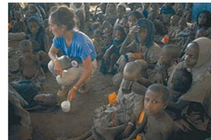
UK Red Cross worker assists drought victims. Bati camp, Ethiopia, 5 Nov 1984

Acting on a recommendation by the Security Council, the General Assembly appointed Kofi Annan by acclamation to a second term of office, beginning on 1 January 2002 and ending on 31 December 2006. ■