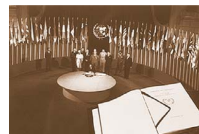
UN Charter close-up; behind, Egypt signs. San Francisco, 26 June 1945 Устав ООН крупным планом; на заднем плане: представитель Египта ставит свою подпись. Сан-Франциско, 26 июня 1945 года