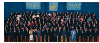
Group photograph of the world leaders at the Special Commemorative Meeting. 22 Oct 1995

Международная конференция по народонаселению и развитию. Каир, сентябрь 1994 года