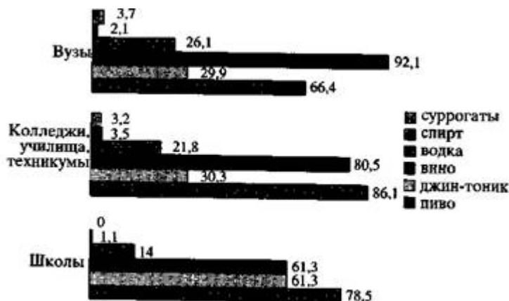
Рис. 2. Структура алкогольных напитков, употребляемых девочками - учащимися школ, средних и высших учебных заведений (%)

Было выявлено, что в данных группах молодежи употребление алкоголя становится массовым . С той или иной частотой в средних и высших учебных заведениях употребляют спиртные напитки 84% юношей и 88% девушек, среди школьников, соответственно, 48% и 58%. Обращает на себя внимание возраст первой пробы алкогольных изделий: мальчики начинали употреблять алкоголь примерно с 11 - 14 лет, девочки - с 12 - 15 лет.