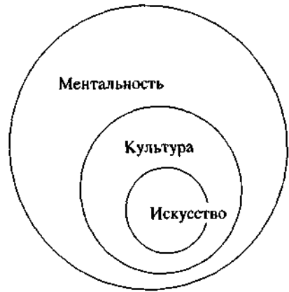
Рис. 4. Модель соотношения понятий "ментальность", "культура" и "искусство"

чиняется закономерностям систем, в которые она входит (культура и ментальность), а с другой - как всякая система функционирует по своим специфическим законам (рис. 4).