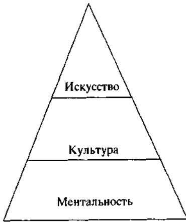
Рис. 3. "Фундамент" искусства