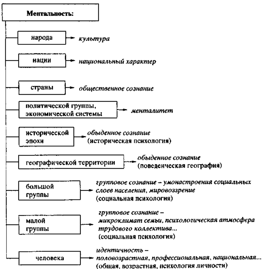
Рис. 1. Использование понятия "ментальность" на разных уровнях обобщения (субъектно-деятельностный подход)

века (как личности, индивидуальности и т.д.). Субъект - это всеохватывающее, наиболее широкое понятие человека, обобщенно раскрывающее единство, целостность, системность его качеств: природных, социальных, общественных, индивидуальных и т.д. Человек как субъект - творец собственной истории, вершитель своего жизненного пути в определенных социально-экономических условиях. Он инициирует и осуществляет специфические виды активности: творческой, нравственной и т.д. В самом полном и широком смысле слова субъект - человечество в целом, представляющее собой противоречивое системное единство субъектов иного масштаба: государств, наций, этносов, общественных классов и групп, индивидов, взаимодействующих друг с другом. Субъект - всегда элемент системы, которая сама может выступать в роли целостного субъекта.