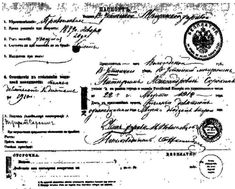
Паспорт П. А. Сорокина, 1911 г.

место рождения, однако привнесли новые сомнения относительно его даты. Документ, выданный Великоустюжской Мещанской Управой в 1911 г. и паспортная книжка 1917 г. свидетельствуют, что их владелец родился 20 января 1889 г., а не 21-го, как утверждал он в автобиографии. Чтобы окончательно прояснить этот вопрос, мы обратились к церковным метрическим книгам Великоустюжского Духовного Правления Вологодской Епархии, исходя из того, что в обоих паспортах Сорокин значится исповедующим православие [10].