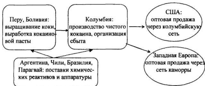
Рис. 3 — 2. Технологическая цепочка кокаинового бизнеса 1980-1990-х годов